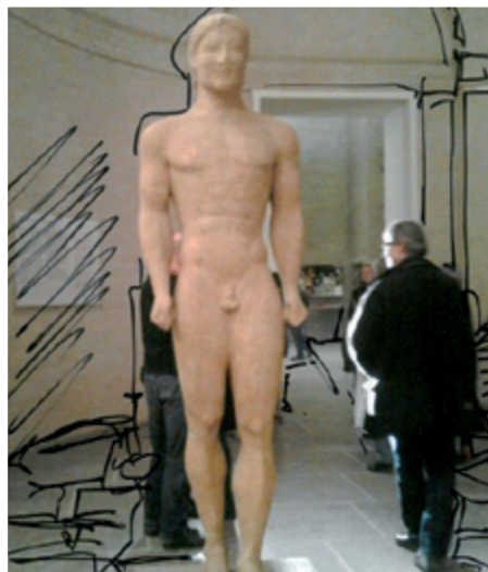
VERNISSEGE, 10. DEZEMBER, 18 UHR, NAZARETH